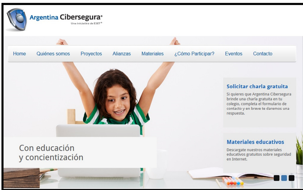
Figura 2 - Pantalla de inicio del Proyecto Argentina Cibersegura

En la Figura 2 puede apreciarse una captura de pantalla del sitio principal del proyecto Argentina Cibersegura.