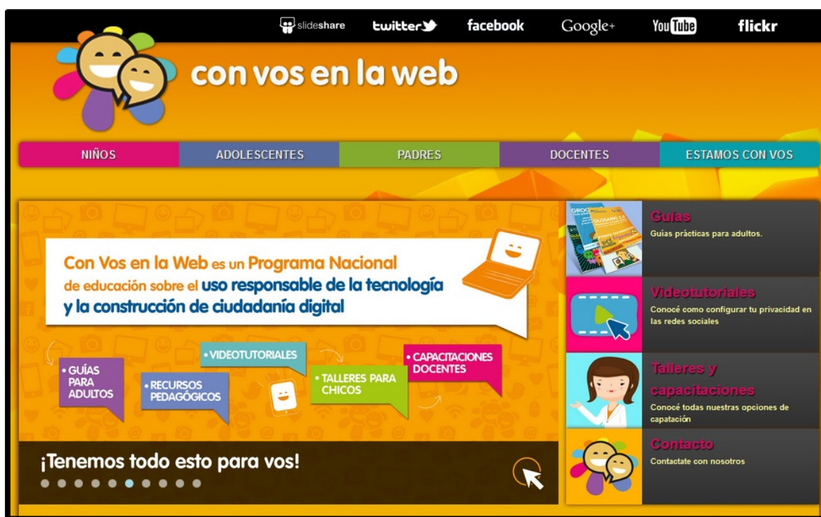
Figura 1 - Pantalla de inicio del Proyecto Con Vos en la Web

En la Figura 1 puede apreciarse una captura de pantalla del sitio principal del proyecto Con Vos en la Web.