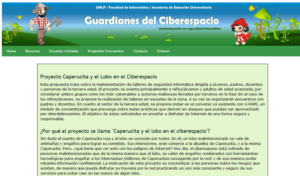
Figura 4– Pantalla de inicio del Proyecto Caperucita y el Lobo en el Ciberespacio. Concientización en seguridad informática para jóvenes y tercera edad.

En la Figura 4 puede apreciarse una captura de pantalla del sitio principal del proyecto Caperucita y el Lobo en el Ciberespacio. Concientización en seguridad informática para jóvenes y tercera edad.